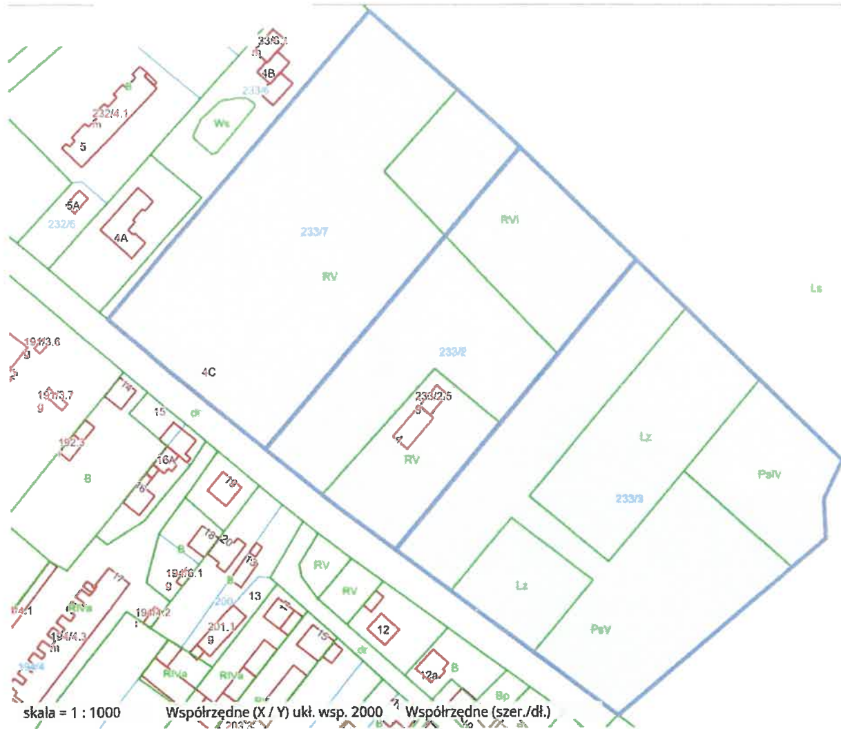
Rys. 2 Potencjalna proponowana granica obszaru objętego opracowywanym mpzp - na tle mapy ewidencyjnej.