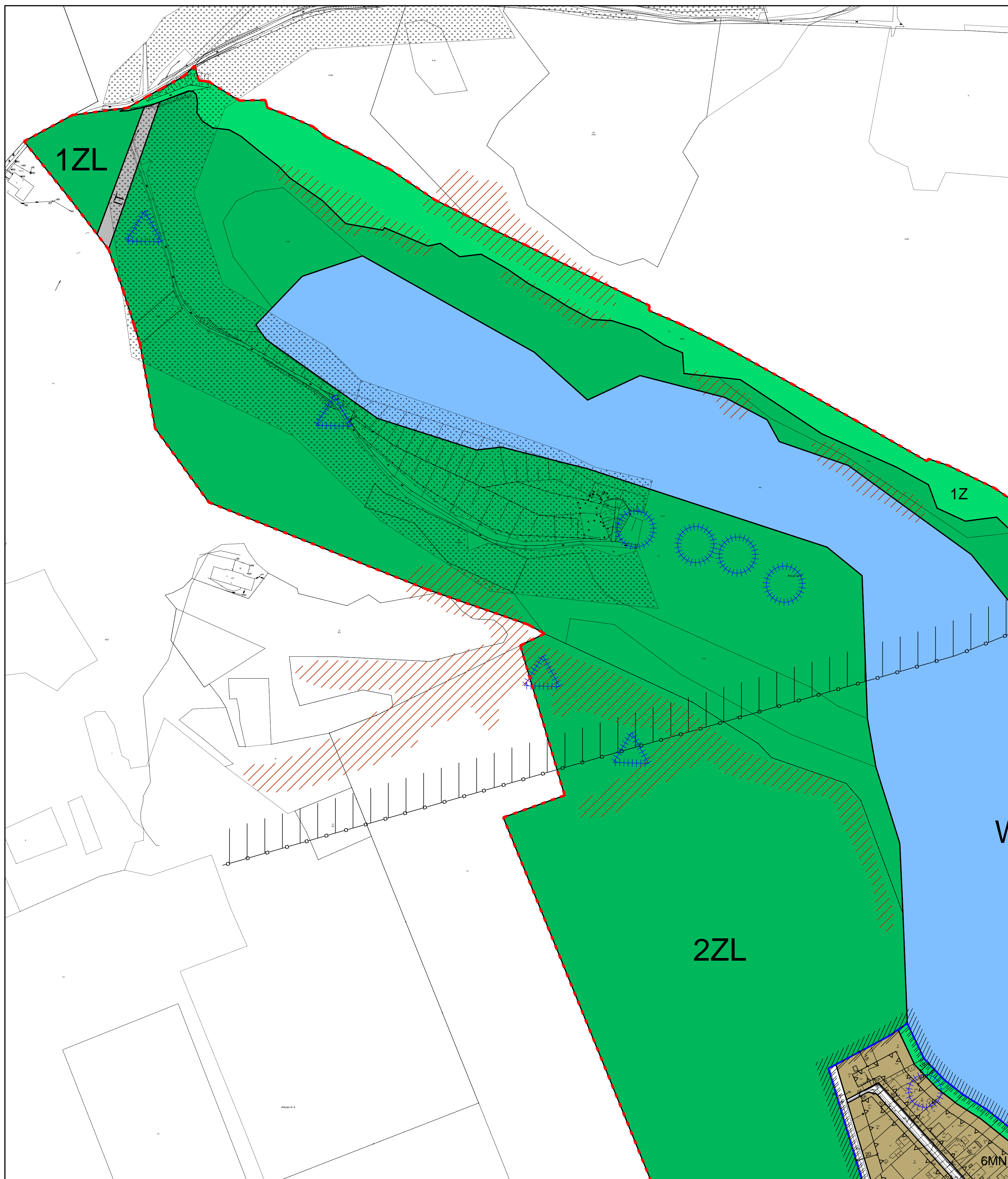
WYRYS ZE STUDIUM UWARUNKOWAŃ I KIERUNKÓW ZAGOSPODAROWANIA PRZESTRZENNEGO GMINY MOSINA skala 1:10 000